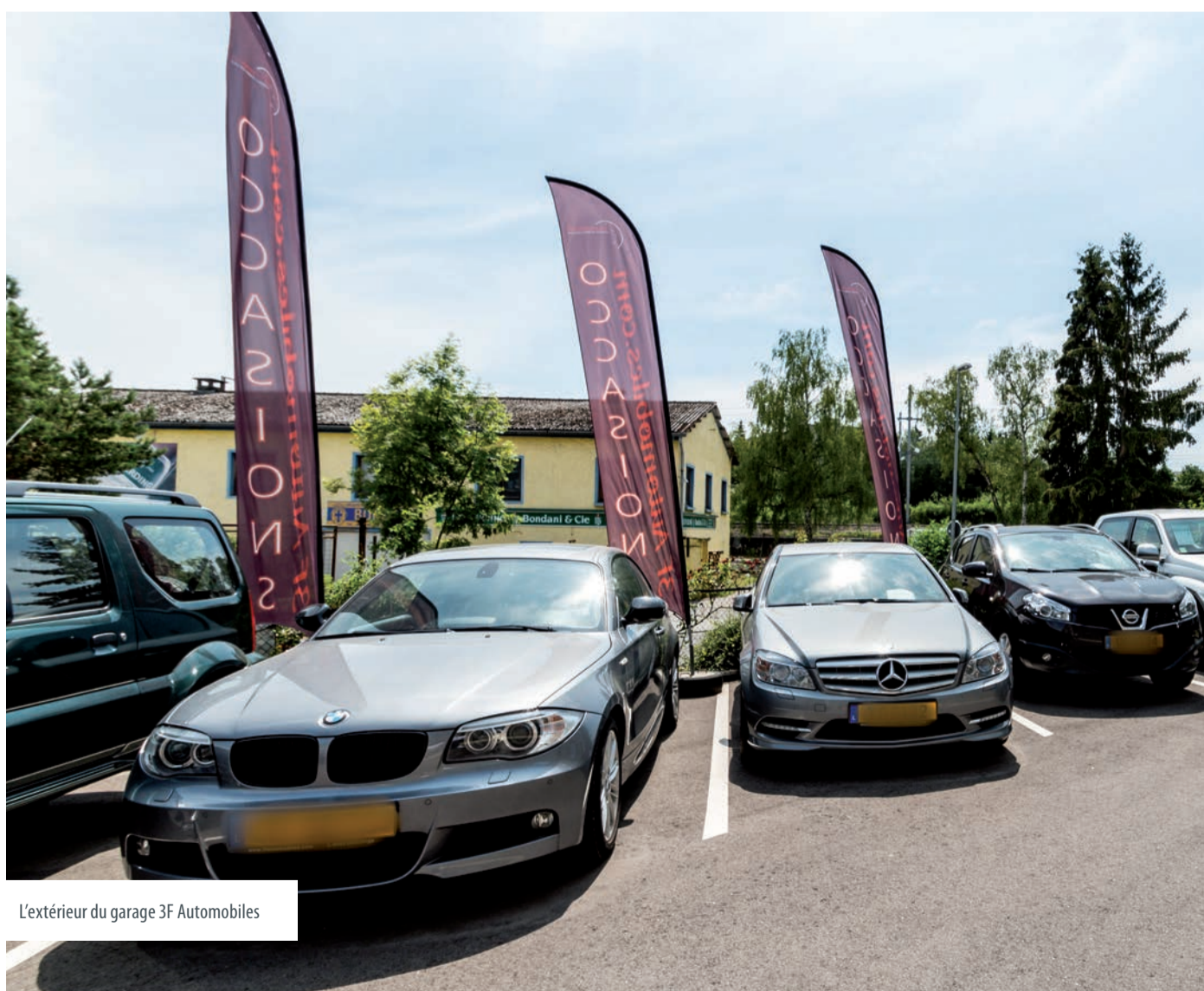
L'extérieur du garage 3F Automobiles